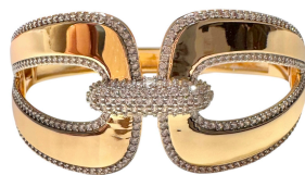
BRACELETE VALLEY GOLD