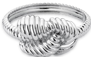
BRACELETE INSPIRED PRATA NÓ TRANÇADO