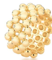
ANEL LARGO ESFERA OURO