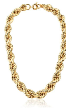
COLAR GROSSO BAIANO VOLTAS 14 MM LISO OURO