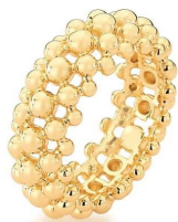
ANEL SEVERAL SPHERES