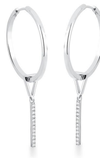
ARGOLA 2 EM 1 PINGENTE PALITO ZIRCÔNIAS SILVER