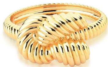
BRACELETE INSPIRED NÓ TRANÇADO OURO