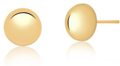
BRINCO HALF SPHERE