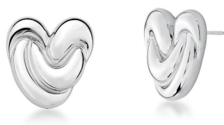
ARGOLA FILIPA PRATA