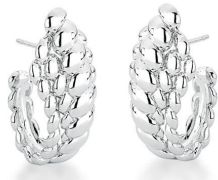
ARGOLA FLORENÇA PRATA