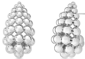
ARGOLA ESFERAS BIG SILVER