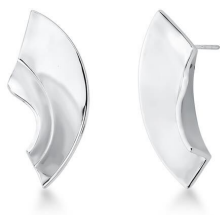
BRINCO CROOKED SILVER