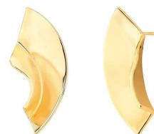
BRINCO CROOKED GOLD