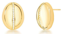
BRINCO OVAL GOLD