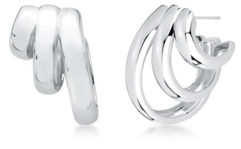
ARGOLA THREE LAPS SILVER