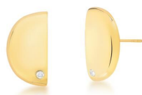
BRINCO SMOOTH SPHERE GOLD