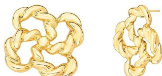
BRINCO LOCKED GOLD