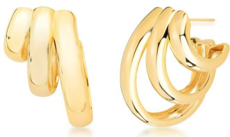
ARGOLA THREE LAPS GOLD