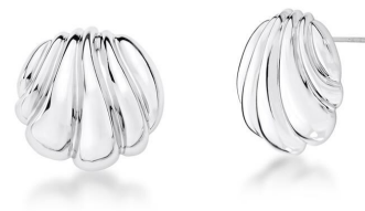
BRINCO SHELL SILVER