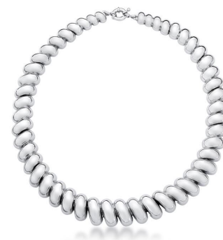
COLAR ARO EM GOMOS LISOS SILVER