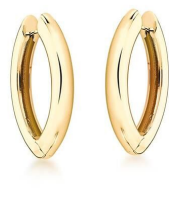
ARGOLA SHUTTLE GOLD