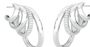
ARGOLA FOUR TURNS SILVER