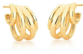
ARGOLA FOUR LAPS GOLD