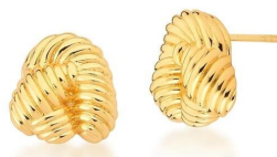
BRINCO TWISTED GOLD