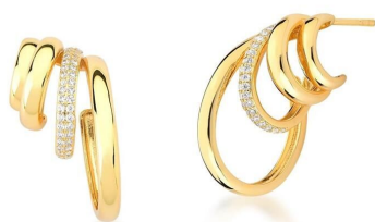
ARGOLA FOUR TURNS GOLD