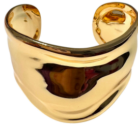
BRACELETE GROSSO DESING GOLD