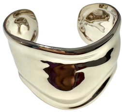
BRACELETE GROSSO DESING SILVER