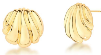
BRINCO SHELL GOLD