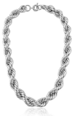
COLAR GROSSO BAIANO VOLTAS 14 MM LISO RODIO