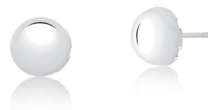
BRINCO HALF SPHERE