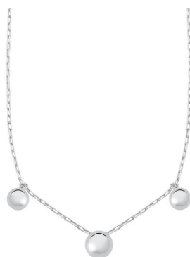
COLAR TRÊS ESFERAS LISAS PRATA