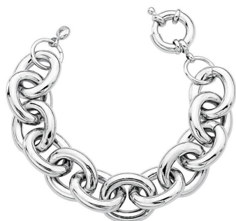
PULSEIRA DE ELOS MÉDIO PRATA