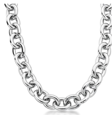
COLAR ELOS OVAIS GROSSO RODIO