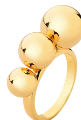
ANEL THREE HIGH SPHERES