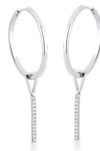
ARGOLA 2 EM 1 PINGENTE PALITO ZIRCÔNIAS SILVER