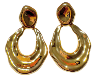
BRINCO COLBIE GOLD