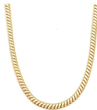
COLAR GROSSO RABO DE RATO ESCAMAS LISO OURO SEMI JOIAS