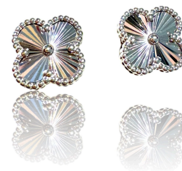
BRINCO INSPIRED TREVO