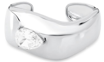
BRACELETE GROSSO GOTA ZIRCÔNIA INSPIRED PRATA