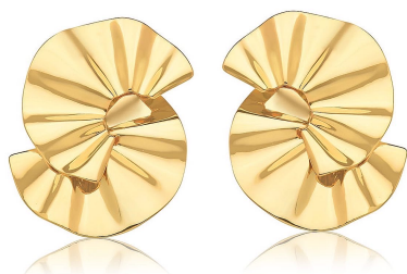
BRINCO CURVO E LISO BANHADO A OURO SEMI JOIAS