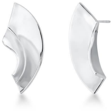
BRINCO CROOKED SILVER