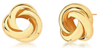
BRINCO THREE LAPS