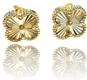
BRINCO INSPIRED TREVO OURO