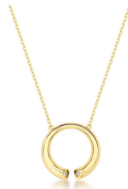
COLAR CURVED PENDANT GOLD