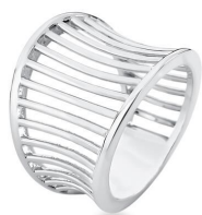
ANEL HOLLOW SILVER