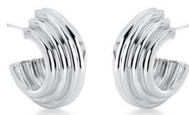
ARGOLA FERNANDA PRATA