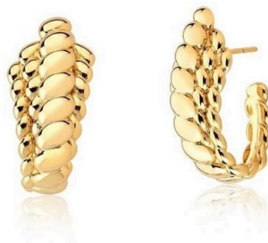
ARGOLA FLORENÇA GOLD