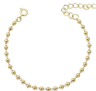
PULSEIRA BOLINHAS MINI OURO