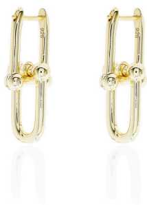
ARGOLA INSPIRED MENOR