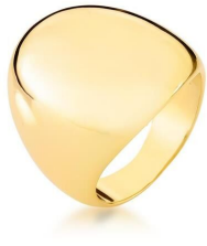
ANEL FLAT OVAL GOLD