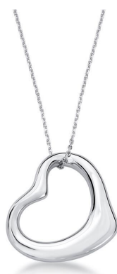
COLAR PINGENTE CORAÇÃO CURVO PRATA