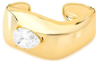
BRACELETE GROSSO GOTA ZIRCÔNIA INSPIRED OURO