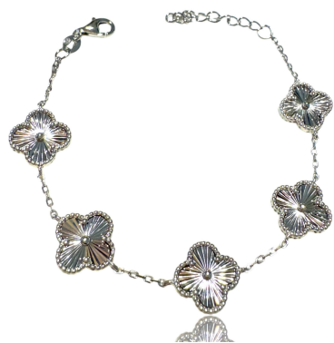
PULSEIRA INSPIRED P TREVO