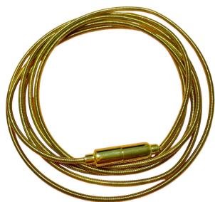
PULSEIRA CORDA DE VIOLÃO GOLD