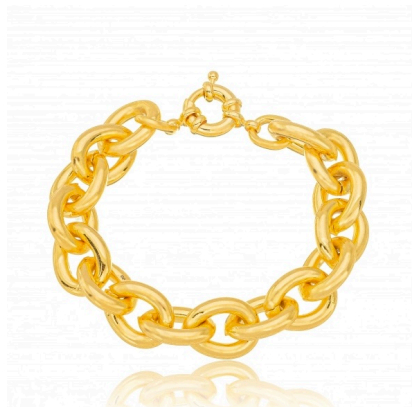
PULSEIRA DE ELOS MÉDIO OURO