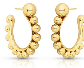
ARGOLA ESFERAS GOLD