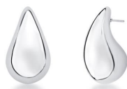
ARGOLA VIRGULA P PRATA