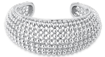
BRACELETE SPHERE SILVER