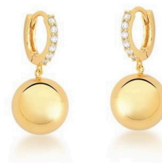
ARGOLA GOLD BALLS