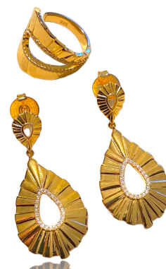
CONJUNTO BRINCO E ANEL ALICE LUXO DESING OURO PRATA 925