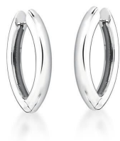
ARGOLA SHUTTLE SILVER