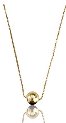
COLAR BOLA 10MM LISO OURO PRATA 925