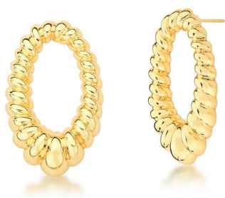
BRINCO HOLLOW OVAL GOLD