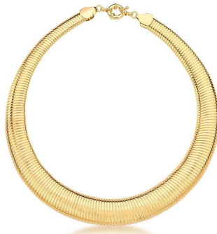
COLAR GARGANTILHA MALEÁVEL OURO