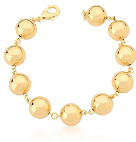
PULSEIRA BOLA INSPIRED OURO