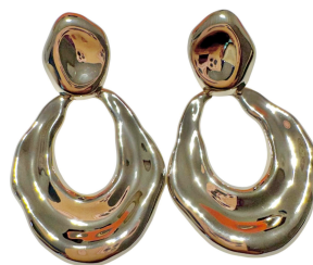
BRINCO COLBIE SILVER