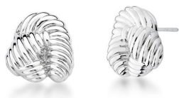
BRINCO TWISTED SILVER