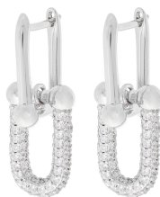
ARGOLA INSPIRED AVERAGE