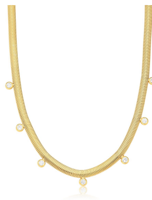
COLAR FLEXÍVEL DELICADO PONTOS DE LUZ OURO JOIAS