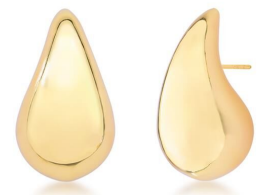
ARGOLA MODA MAXI GG OURO