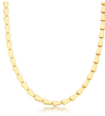
COLAR GARGANTILHA TRAMA ESCAMAS