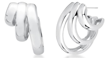
ARGOLA THREE LAPS SILVER