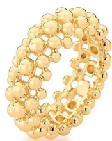
ANEL SEVERAL SPHERES