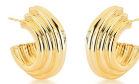
ARGOLA FERNANDA OURO