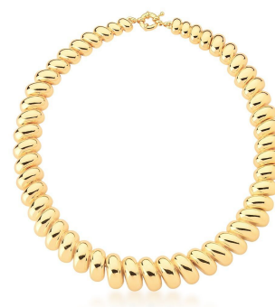
COLAR ARO EM GOMOS LISOS GOLD