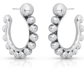
ARGOLA ESFERAS SILVER