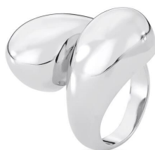
ANEL TWO DROPS SILVER