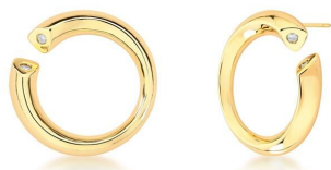
BRINCO CURVED PENDANT GOLD