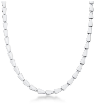
COLAR GARGANTILHA TRAMA ESCAMAS SILVER