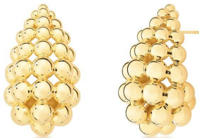
ARGOLA ESFERAS BIG