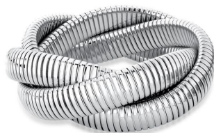
BRACELETE TRANÇADO MALEÁVEL TEXTURIZADO EM AÇO