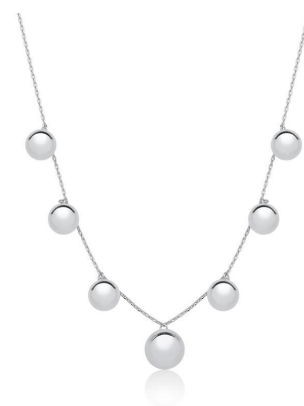
COLAR COM SETE ESFERAS LISAS DISPERSAS PRATA