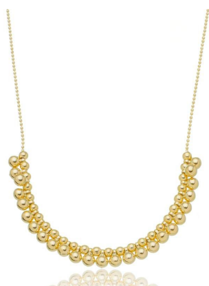
COLAR BOLINHAS MINI INSPIRED OURO