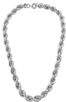
COLAR GROSSO ENTRELAÇADO LISO RODIO BRANCO SEMI JOIAS