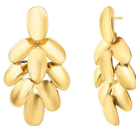
BRINCO PETALS GOLD