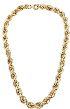
COLAR GROSSO BAIANO DUAS VOLTAS 9MM LISO OURO SEMI JOIAS