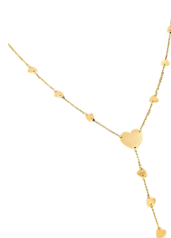
COLAR GRAVATINHA CORAÇÕES LISOS OURO PRATA925