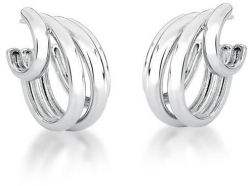
ARGOLA FOUR LAPS GOLD SILVER