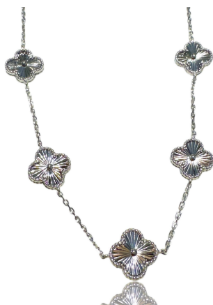
COLAR INSPIRED TREVO PRATA 925