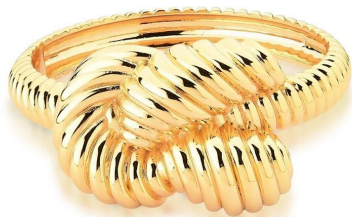
BRACELETE INSPIRED NÓ TRANÇADO OURO