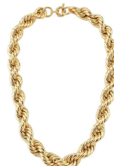
COLAR GROSSO BAIANO VOLTAS 14 MM LISO OURO