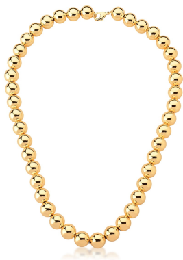
COLAR BOLAS M OURO SEMI JOIAS