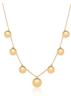
COLAR COM SETE ESFERAS LISAS OURO