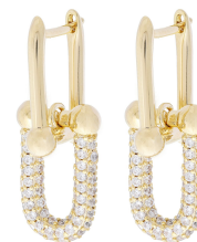
ARGOLA INSPIRED AVERAGE