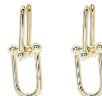
ARGOLA INSPIRED MAIOR