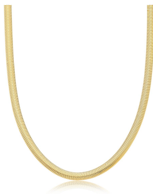
COLAR FLEXÍVEL DELICADO LISO OURO JOIAS