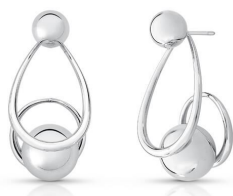
BRINCO BALLS SILVER