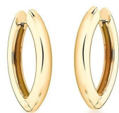
ARGOLA SHUTTLE GOLD