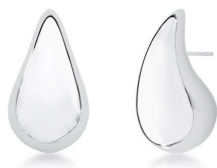
ARGOLA VIRGULA M PRATA