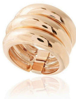
ANEL TRIPLE HOOP