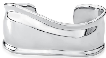
BRACELETE GROSSO INSPIRED PRATA