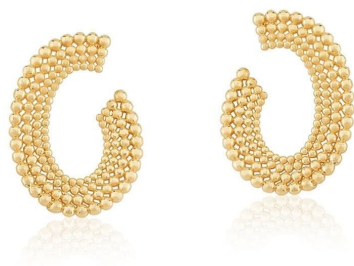
BRINCO MULTI ESFERAS