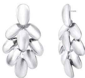
BRINCO PETALS SILVER