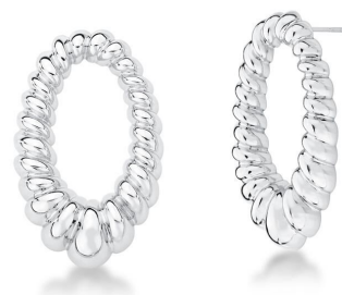
BRINCO HOLLOW OVAL SILVER