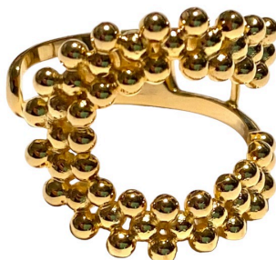
ANEL HORSESHOE OURO