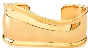
BRACELETE GROSSO INSPIRED OURO