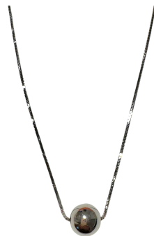
COLAR BOLA 10MM LISO PRATA 925