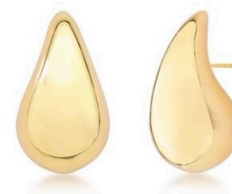
ARGOLA MODA VAZADA