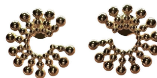
ARGOLA CIRCLE SPHERES