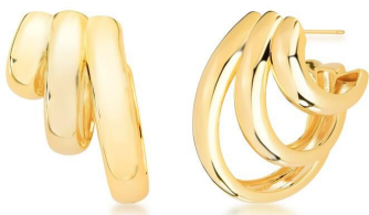
ARGOLA THREE LAPS GOLD