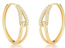
ARGOLA VANCE GOLD