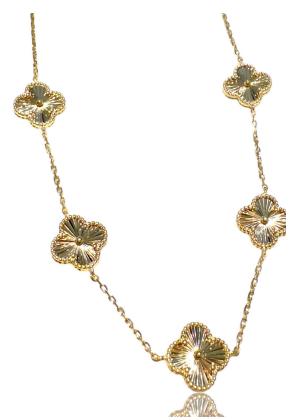
COLAR INSPIRED TREVO OURO PRATA 925