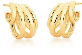
ARGOLA FOUR LAPS GOLD