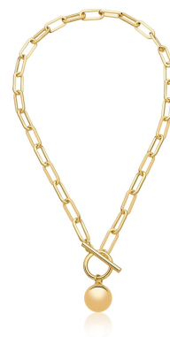
COLAR BOLA INSPIRED OURO