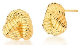
BRINCO TWISTED GOLD