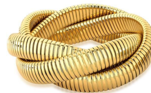
BRACELETE TRANÇADO MALEÁVEL TEXTURIZADO EM AÇO