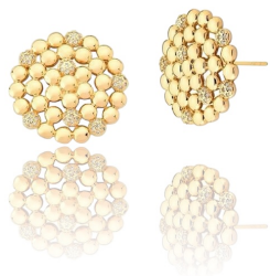
BRINCO MULTI ESFERAS