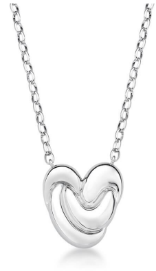
COLAR FILIPA PRATA