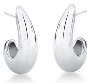
BRINCO LARA SILVER