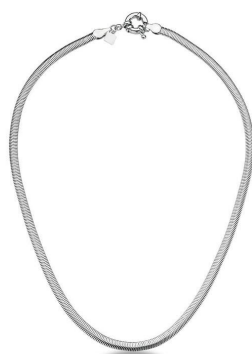
COLAR FLEXÍVEL DELICADO LISO SILVER