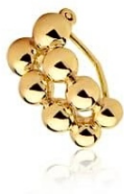
PIERCING GOLD BALLS