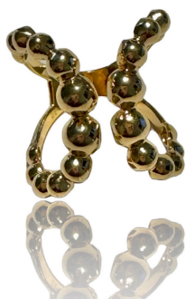
ANEL X SPHERES OURO