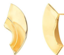
BRINCO CROOKED GOLD