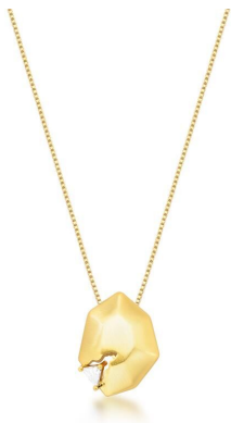
COLAR DIAMOND GOLD