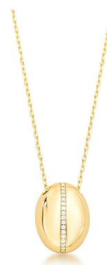
COLAR OVAL GOLD