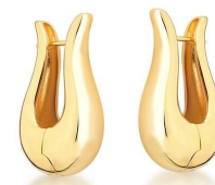
ARGOLA LISA GOLD