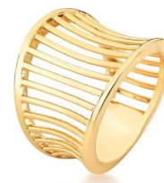
ANEL HOLLOW GOLD