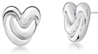
ARGOLA FILIPA PRATA