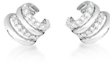
PIERCINGS LUXO QUATRO VOLTAS ZIRCÔNIAS LISO