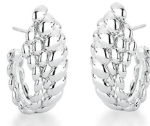
ARGOLA FLORENÇA PRATA