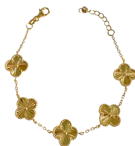
PULSEIRA INSPIRED P TREVO OURO