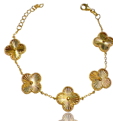
PULSEIRA INSPIRED M TREVO OURO