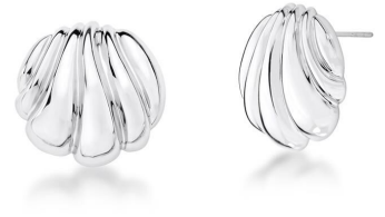
BRINCO SHELL SILVER