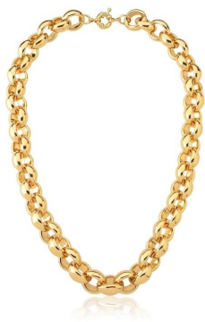
COLAR ELOS OVAIS LISOS GOLD