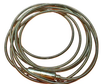
PULSEIRA CORDA DE VIOLÃO SILVER