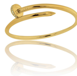
BRACELETE INSPIRED PREGO OURO