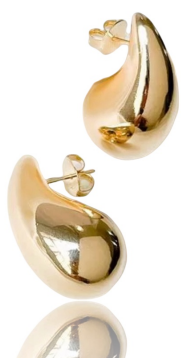
ARGOLA VIRGULA P GOLD