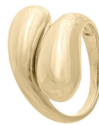
ANEL DOUBLE DROPS