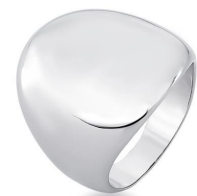
ANEL FLAT OVAL SILVER