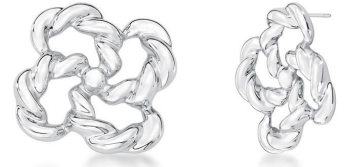
BRINCO LOCKED SILVER