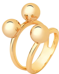
ANEL THREE SPHERES