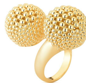
ANEL TWO SPHERES GOLD