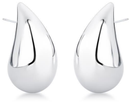
ARGOLA MODA MAXI GG PRATA