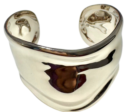
BRACELETE GROSSO DESING SILVER