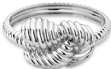
BRACELETE INSPIRED PRATA NÓ TRANÇADO