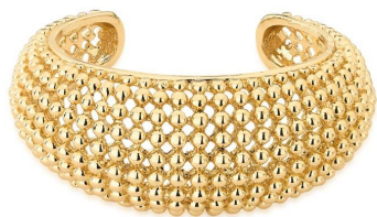
BRACELETE SPHERE GOLD