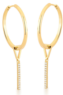
ARGOLA 2 EM 1 PINGENTE PALITO CRAVEJADO GOLD