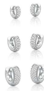
KIT TRÊS PARES DE ARGOLAS ZIRCÔNIAS BRANCAS SILVER