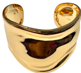
BRACELETE GROSSO DESING GOLD