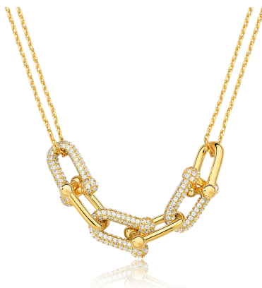
COLAR ELOS LISOS E ZIRCÔNIAS CRISTAIS OURO SEMI JOIAS