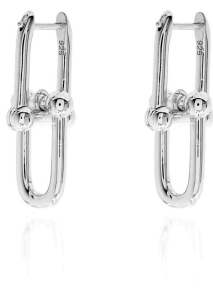
ARGOLA INSPIRED MENOR