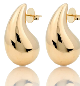
ARGOLA VIRGULA P OURO JOIAS