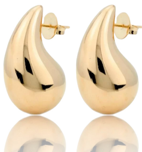
ARGOLA VIRGULA M OURO JOIAS