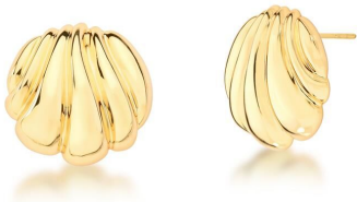
BRINCO SHELL GOLD