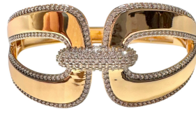
BRACELETE VALLEY GOLD