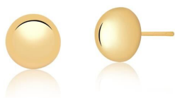
BRINCO HALF SPHERE