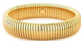
BRACELETE MALEÁVEL TEXTURIZADO LISO EM AÇO OURO