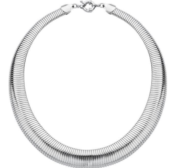
COLAR GARGANTILHA MALEÁVEL SILVER