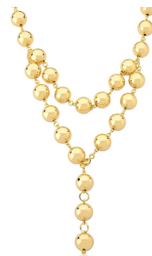
COLAR GRAVATA COM ESFERAS LISAS OURO SEMI JOIAS