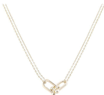
COLAR ELOS DUPLO LISOS OURO INSPIRED PRATA 925