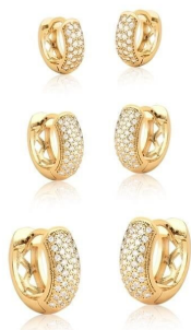
KIT TRÊS PARES DE ARGOLAS ZIRCÔNIAS BRANCAS GOLD