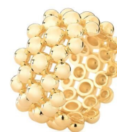
ANEL LARGO ESFERA OURO