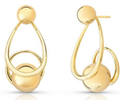
BRINCO BALLS GOLD